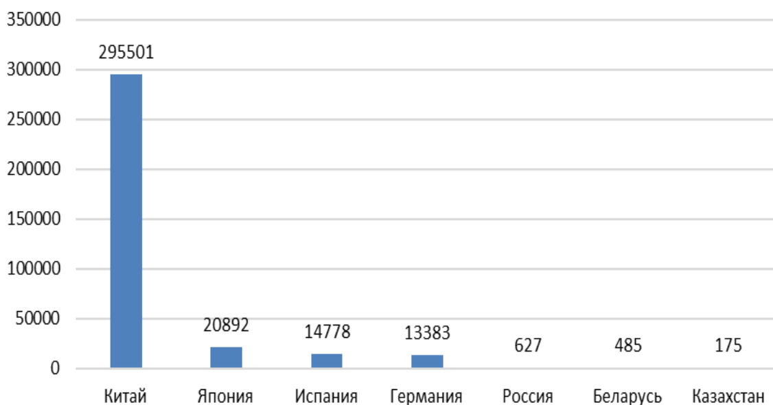
Рис. 1. Количество действующих сертификатов серии ISO 14001 в отдельных странах мира в 2022 году (составлено авторами по данным [6])

Статистические данные, представленные на рис. 1, подтверждают, что СЭМ признана во многих странах мира. При этом отметим, что на предприятия сферы энергетики приходится незначительная доля действующих сертификатов серии ISO 14001 (таблица).