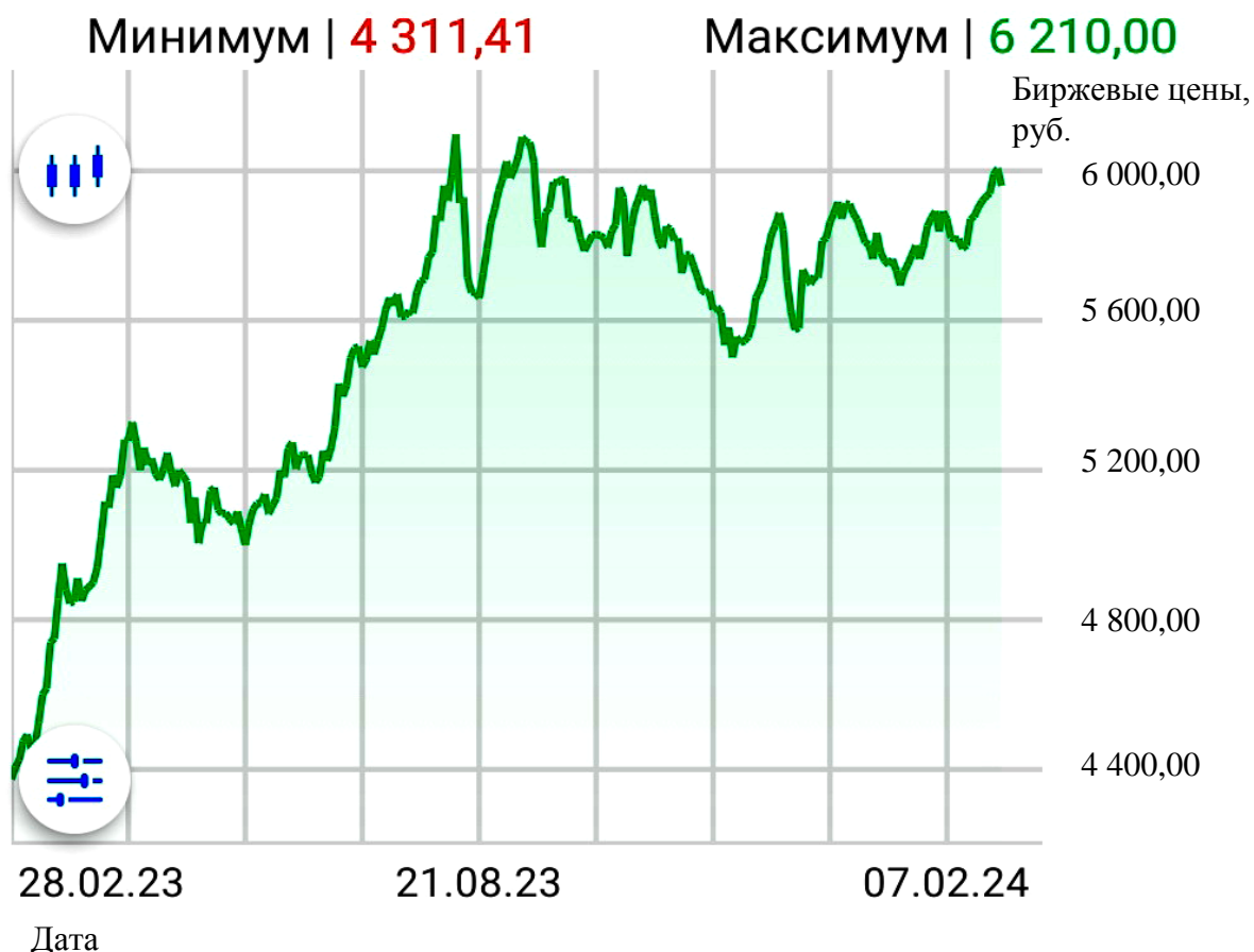
Рис. 1. Динамика биржевых цен на золото в РФ [2]

До 2024 г. добывать золото в Российской Федерации имели право лишь юридические лица (горнодобывающие предприятия), у которых есть лицензия на пользование недрами. Согласно новому проекту закона, вольные старатели могут разрабатывать новые небольшие россыпи золота или выработанные россыпи, которые являются вторичными искусственными техногенными месторождениями, оставшимися в качестве отвалов пустой некондиционной породы. Практика добычи золота вольными старателями очень популярна в Австралии и Канаде, однако объемы добычи такого россыпного золота в этих странах невелики. Кроме того, существуют ограничения на геотехнологии, с помощью которых проводится добыча золота старателями. Однако так ли хорош законопроект «О старательской деятельности»? Какие плюсы и минусы могут возникнуть при его применении?