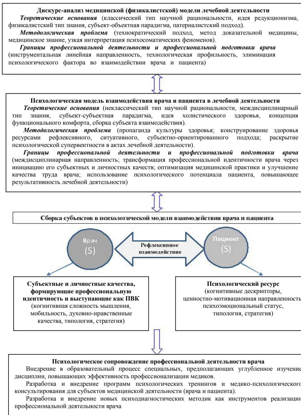
Рис. 2. Структура сборки субъектов в лечебной деятельности (ПКВ – профессионально важные качества)

Базовые основания для сборки субъектов – это такие основания, которые определяют ведущие мотивы субъектов в их ориентации на процессы сборки. Среди такого рода оснований в первую очередь следует назвать общность ценностей, культуры, целей; комплексные основания, формируемые, например, в процессах проектной идентификации.