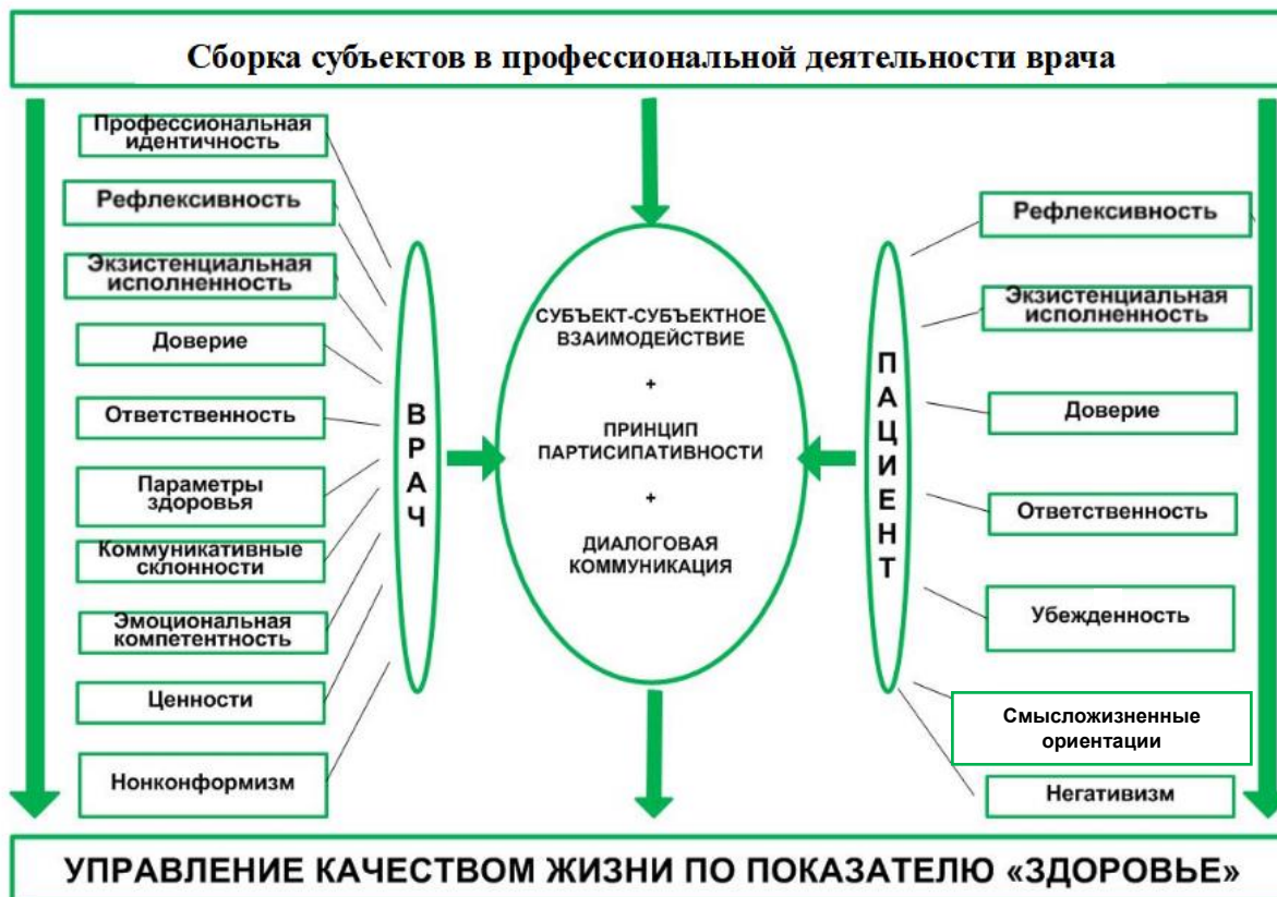
Рис. 4. Структура сборки субъектов в профессиональной деятельности врача

В настоящее время проходит философско-методологическую и эмпирическую апробацию разрабатываемая Л.А. Мурашовой рефлексивно-экзистенциальная психологическая модель управления качеством жизни по показателю здоровья пациента в профессиональной деятельности врача для персонализированной медицины. Она инициирует сборку субъектов в вышеуказанной деятельности (рис. 4) [9].