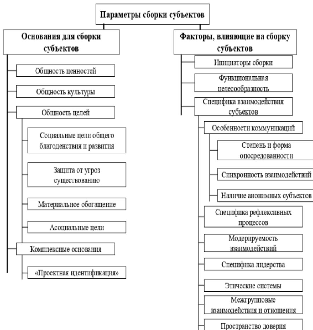
Рис. 1. Структура сборки субъектов, ориентированных на развитие

реальности (мировоззренческие аспекты, принципы, онтологии и др.), и с этой позиции производится оценка проектов [5, с. 94]. Ранее автором статьи были представлены вариант структуры сборки субъектов (рис. 1) и анализ отдельных ее параметров.